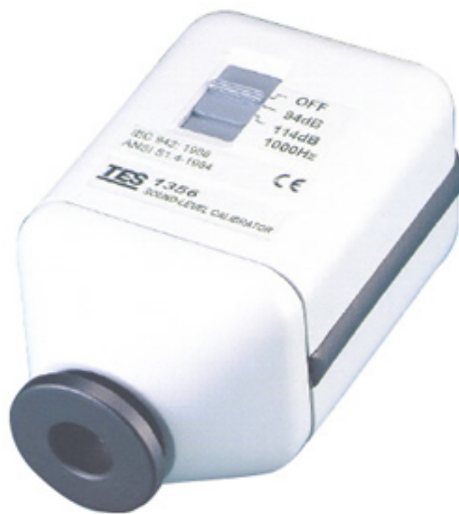
Calibrador de sonido TE-1356