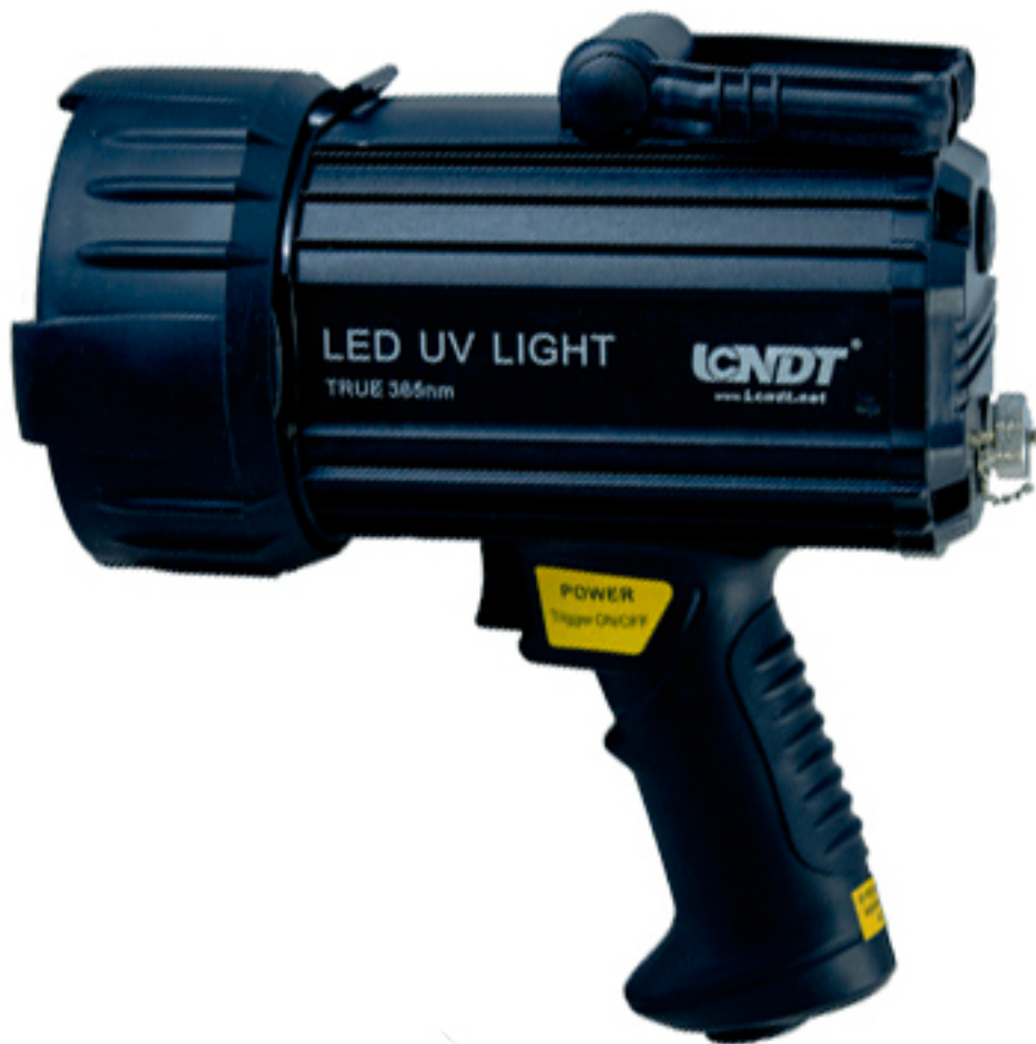
Spot de luz negra LC-UV100B