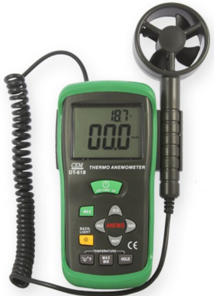
Termo Anemómetro Digital CM-DT618