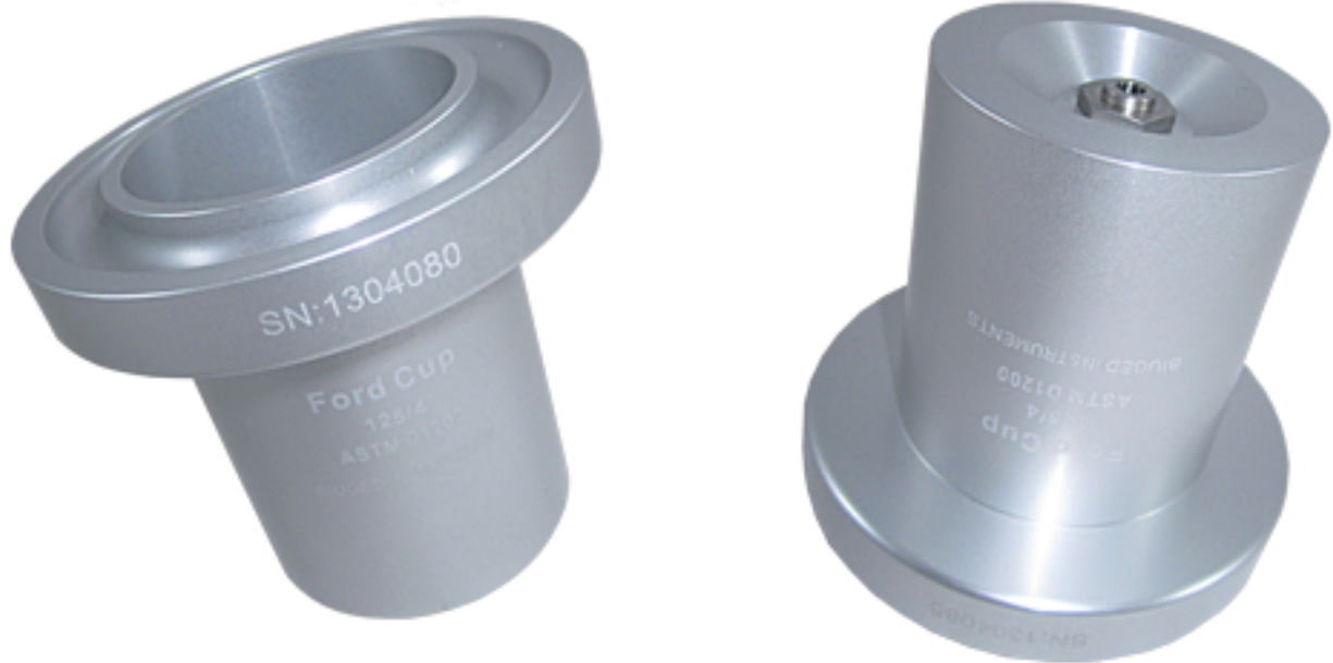
Viscosímetro copa Ford BL-FC